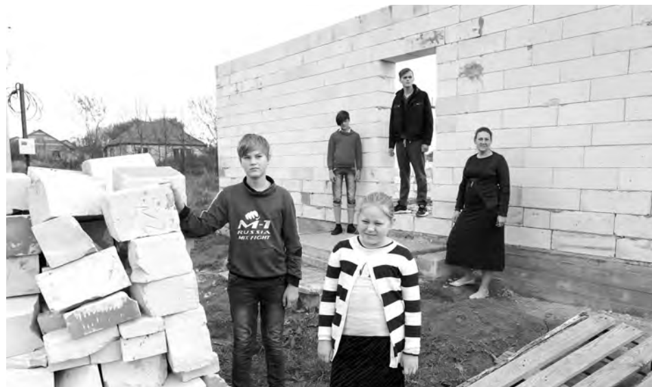
Если не накрыть новостройку к зиме, стены начнут разрушаться.