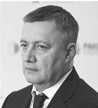
Игорь Кобзев, губернатор Иркутской области

А ведь, помимо аэропорто-вых объектов, необходимо со-здание дорогостоящей дорож-ной инфраструктуры. В част-ности, моста через Ангару. Ина-че жители городов и поселе-ков вдоль федеральной трассы вынуждены будут делать бо-льшой крюк, добираясь до Усть-Орды через Иркутск. ●