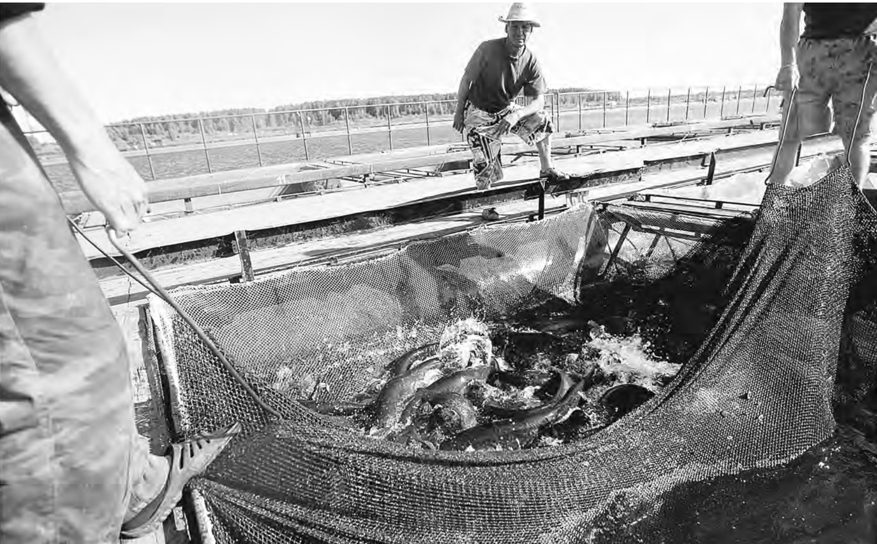
ПАВЕЛ ЛИСИЦЫН / ТРАКТОРИСТЫ

ситуация Смогут ли осетровые предприятия в Астрахани сохранить маточное поголовье