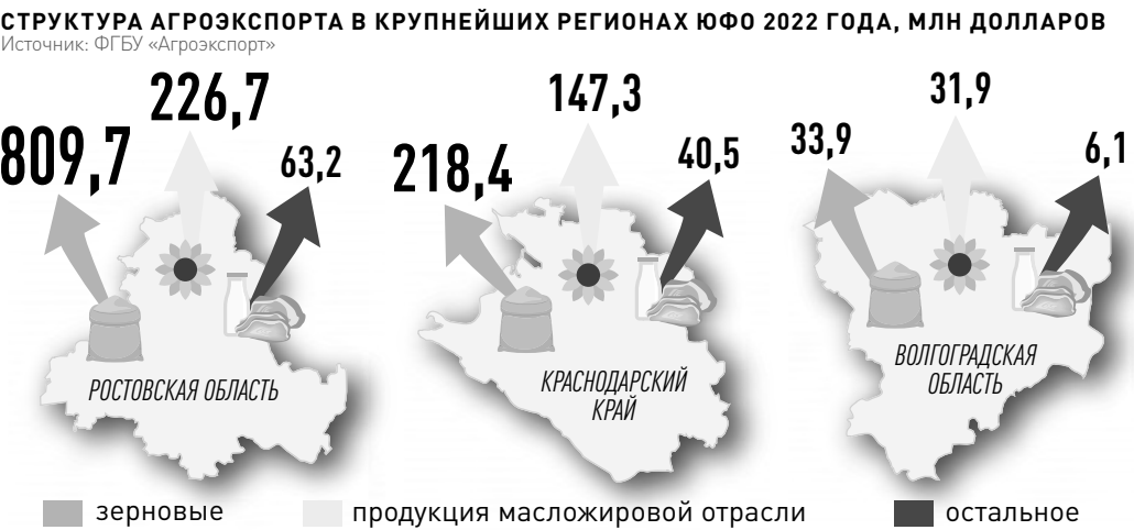
ИНФОРМАЦИЯ «РГ» / ИРИНА ТЕПЛОВА

РОСТОВ-НА-ДОНУ: ул. Московская, 51/15, 4-й этаж. Телефон: (863) 261-91-41. E-mail: rostov@rg.ru ВОЛГОГРАД: ул. Мира, д.19, офис 517. Телефон: (8442) 92-35-08. E-mail: nvolog-r@mail.ru КРАСНОДАР: ул. Северная, 324а, 5-й этаж. Телефон: (861) 259-21-11. E-mail: rgkrsnodar@mail.kuban.ru СИМФЕРОПОЛЬ: ул. Пролетарская, 1 «А», офис 37. Телефон (3652) 60-02-13, 60-16-26. E-mail: il2009@list.ru