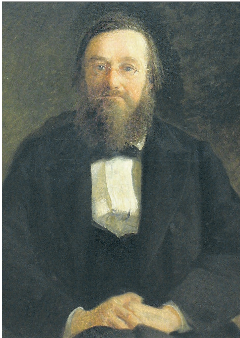
ХУДОЖНИК НИКОЛАЙ ГЕ. 1870 ГОД

К 200-летию Николая Ивановича Костомарова