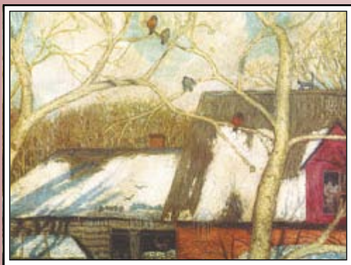
Н. Крымов К весне 1907 г.