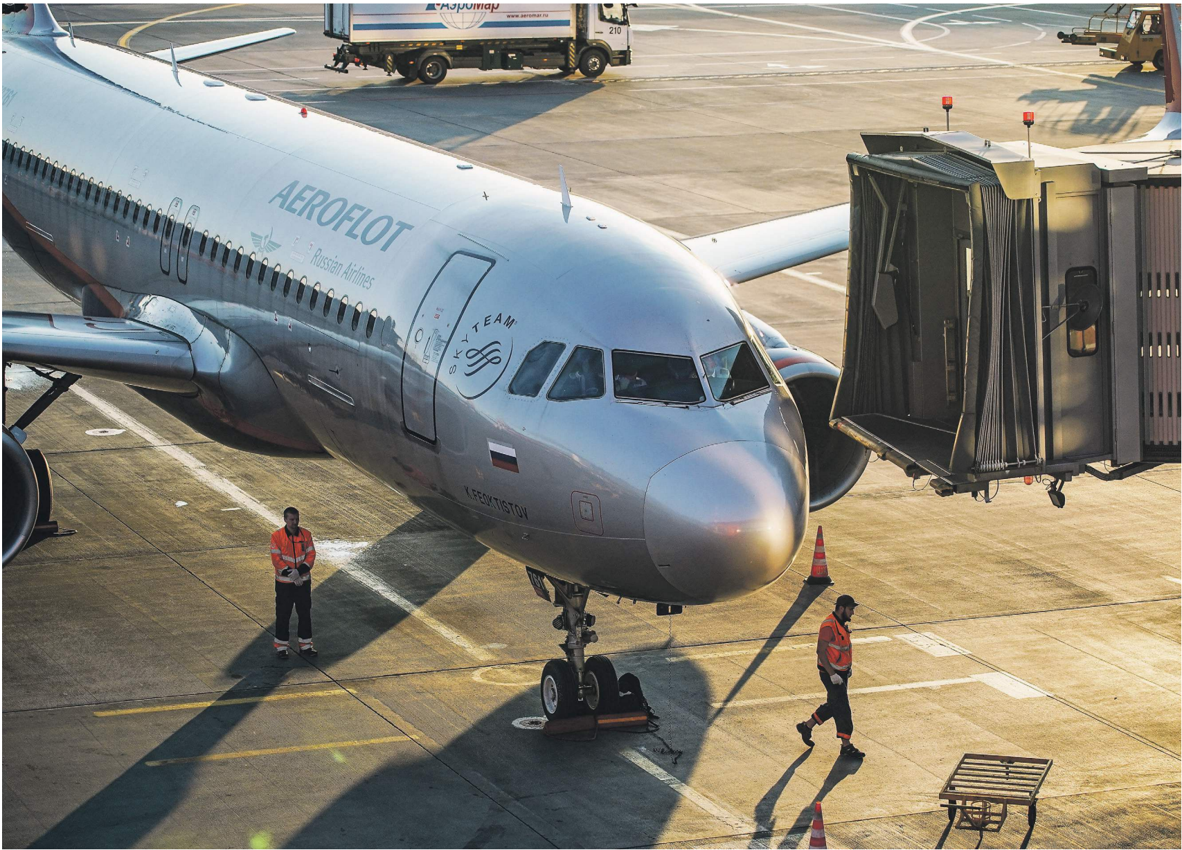
Сергей Лавинский / Известия