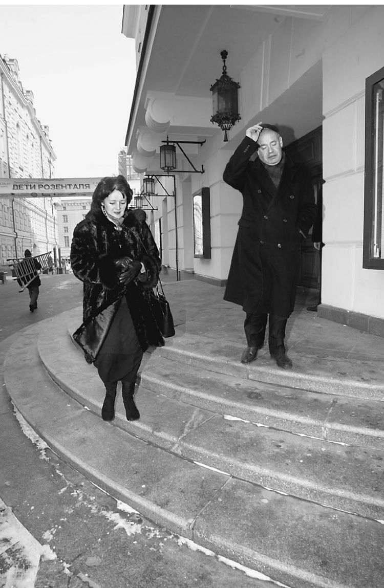
После спектакля Михаил Швыдкой предусмотрительно вышел не из тех дверей, откуда вышла группа возмущенных депутатов

— Я не депутат Госдумы, на счет шума вокруг этой постановки ничего не знаю, — умело уходил от ответа кинорежиссер Никита Михалков, впрочем, выбравший наиболее выгодную позицию перед телекамерами. — Это, по первому впечатлению, такая сборная КВН Большого театра. На жизнь имеет право все, другой вопрос — где. Человек, занимающийся искусством, не должен его оценивать. Моя точка зрения? Меня это не волнует. Как сказал Бергман: «Искусство должно потрясать, попадая в сердце зрителя, минуя промежуточную посадку в области интеллекта». → стр. 2