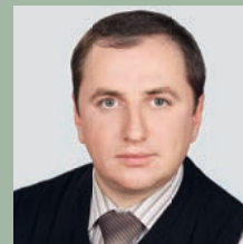
ДУБОВИК Антон Викторович , начальник Управления бюджетного учета и отчетности Казначейства России