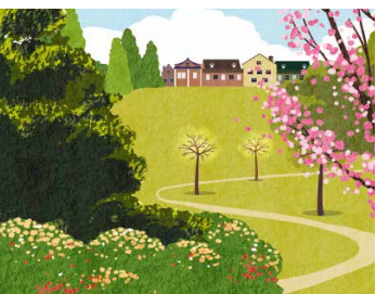
Рисунок на обложке: Shutterstock.com

ПРИЗ ЗА ПОДПИСКУ 10 подарков для первых подписавшихся в июле