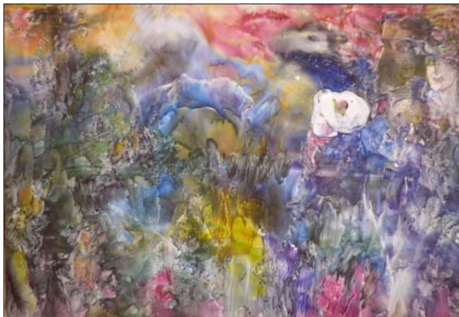
Вечная весна. Акварель. 2012 год