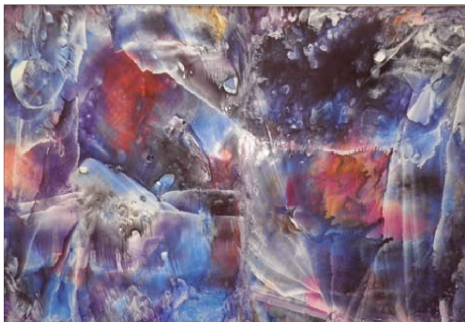
Лунный свет. Акварель. 2012 год