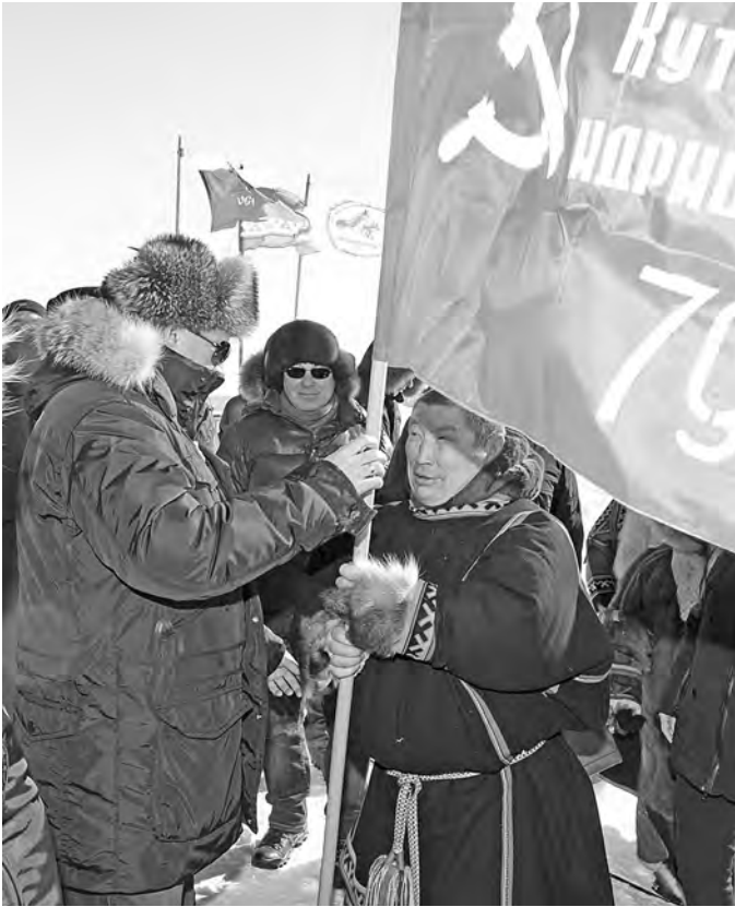
Оленоводы отправились в заезд со Знаменем Победы.