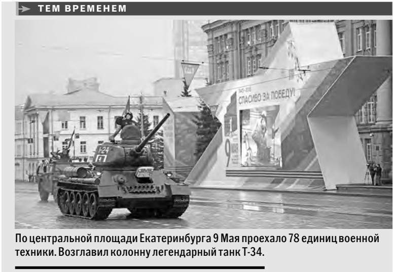
По центральной площади Екатеринбурга 9 Мая проехало 78 единиц военной техники. Возглавил колонну легендарный танк Т-34.

мур Акчурина. — Олени вывозили раненых, оружие, боеприпасы. Эти животные выносливы, не издают звуков, поэтому их активно использовали на фронте. Северный фланг обороны Советский Союз держал на Кольском полуострове и Северном побережье Финского залива. Оленно-транспортные батальоны формировали в основном из представителей коренных народов. В Мурманской и Архангельской областях оленеводов призывали вместе со стадами оленей. С Ямала на войну ушло почти девять тысяч человек, домой не вернулся каждый четвертый. Трех тысяч бойцов наградили орденами и медалями. Из них 570 — это ханты, манси и ненцы.