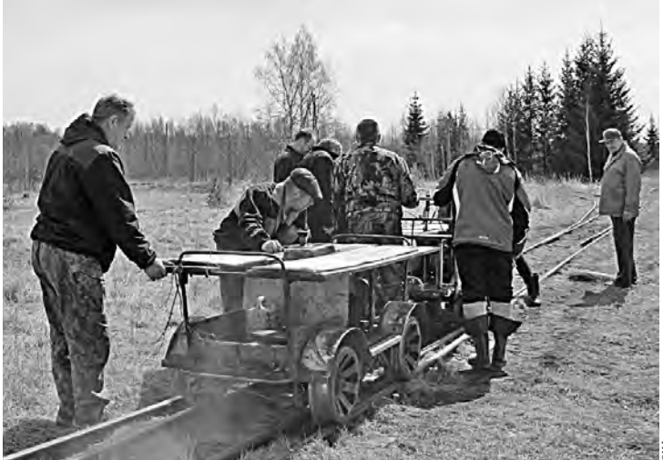
Чтобы навестить могилы ветеранов в День Победы, жителям поселка приходится рисковать жизнью.