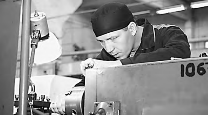
ОТДЕЛ МЕДИАТЕХНОЛОГИЙ И МАНОФЕЙТОВ СМ-ГРАФИ

В Российском федеральном ядерном центре (РФЯЦ, Саров, Нижегородская область), прошел конкурс профессионального мастерства «Золотые руки» среди рабочих РФЯЦ и муниципальных предприятий города. Итоги подведут завтра: победителей среди токарей, фрезеровщиков, сварщиков и других специалистов определят в двух возрастных категориях (до 30 и свыше 30 лет). Всего в конкурсе приняли участие около 200 человек.