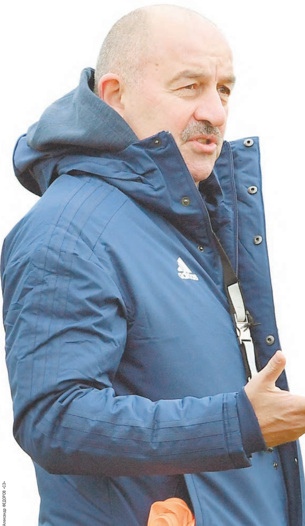
Александр ФЕДОРОВ «СЭ»

Эксклюзивное интервью главного тренера сборной России по итогам матчей с Бельгией (1:3) и Казахстаном (4:0)