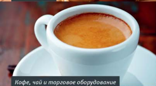
Кофе, чай и торговое оборудование