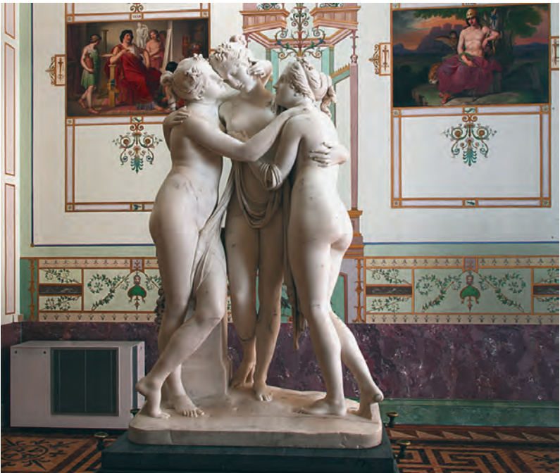
Антонио Канова (1757–1822). Три Грации. Италия. Между 1813– 1816 гг. Мрамор. Высота 182 см. Инв. № Н. ск. — 506