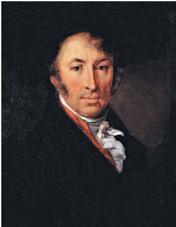
В.А. Тропинин. Портрет Н.М. Карамзина. 1818 г. Холст, масло. Государственная Третьяковская галерея