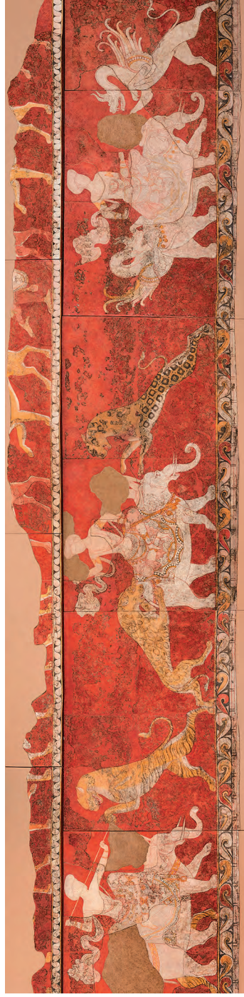
Стенная роспись. Узбекистан, Варахша. Конец VII – начало VIII в. Композиция построена на повторении одного и того же сюжета – сражении восседающего на слоне персонажа с двумя хищными животными или чудовищами. Предположительно показан верховный царь согдийских богов Адбаг в противоборстве с силами зла. Минеральные краски, роспись по лессовой штукатурке. Размер 163 × 902 см. Инв. № СА-14658-14675