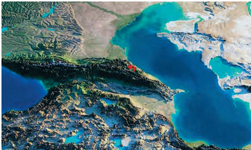
Местоположение стоянки Айникаб 1