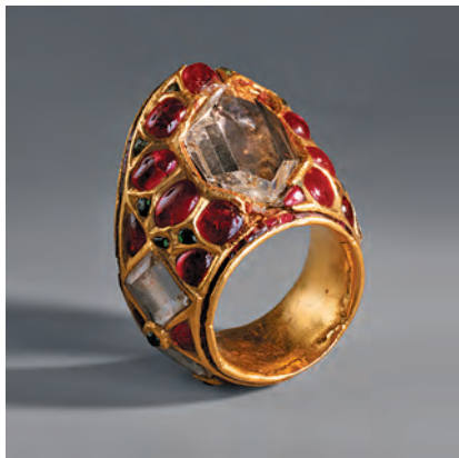
Парадное кольцо Шаха-Джахана для стрельбы из лука. Индия. Династия Великих Моголов. Вторая четверть XVII в. Золото, алмазы, рубины, изумруды. Диаметр 4 см. Инв. № V3-703