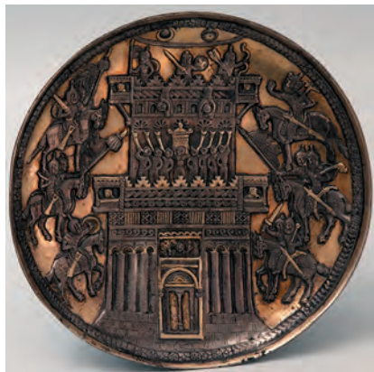
Блюдо со сценой осады замка. Иран. III–VII вв. Серебро, чеканка, позолота. Диаметр 23,3 см. Инв. № S-46