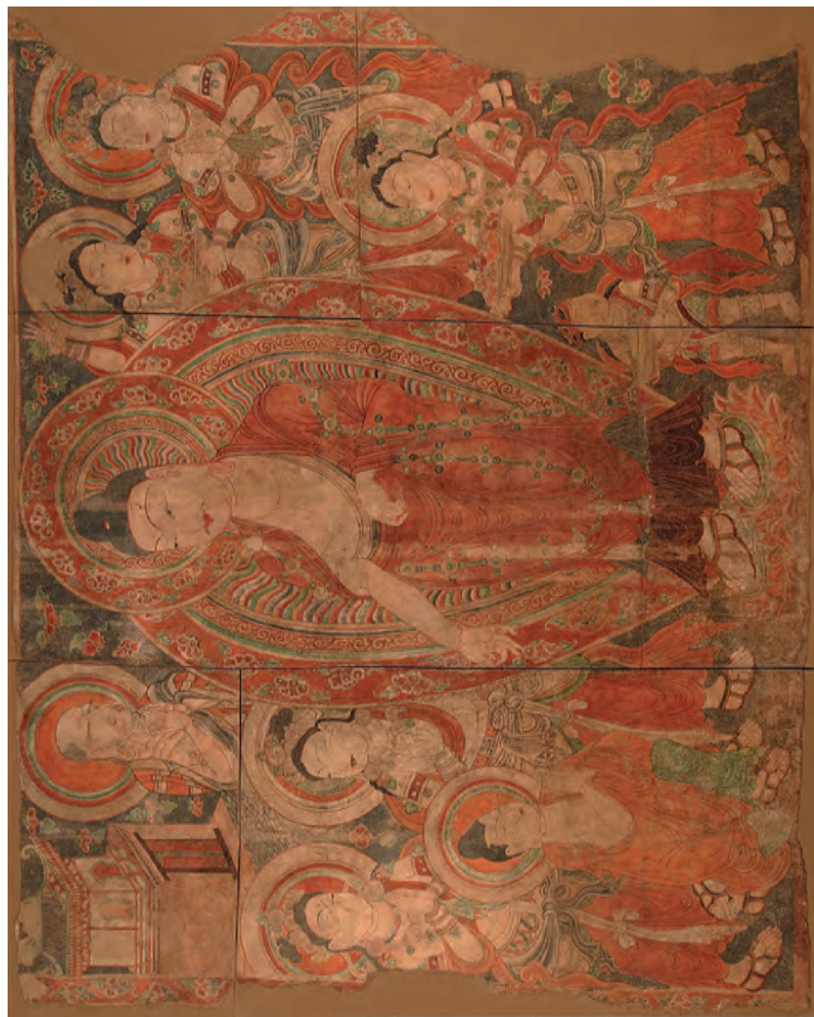
Роспись стены. Сцена granīdhi (панно из 17 фрагментов). Стоящий на двух лотосах Будда, предстоящие, архат, коленопреклоненный Будда, божества, карлик. Турфан. X в. Живопись по лессу. Общий размер панно 310×240 см. Инв. № ТУ-775