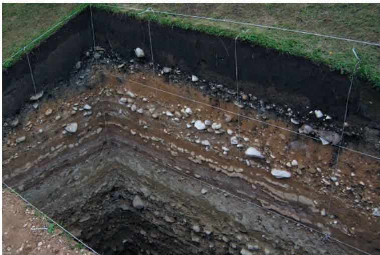
Айникаб 1. Раскопки 2006–2007, 2009 гг. Характер отложений стоянки