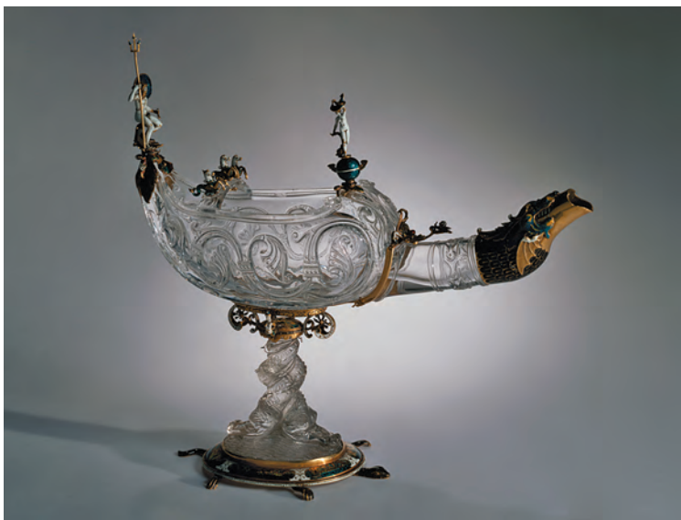
Светильник. Египет. Вторая половина X в. (камень). Италия. Конец XVI в. (оправа). Горный хрусталь, золото, эмаль. Размер 26,5 × 22 см. Инв. № ЕГ-938