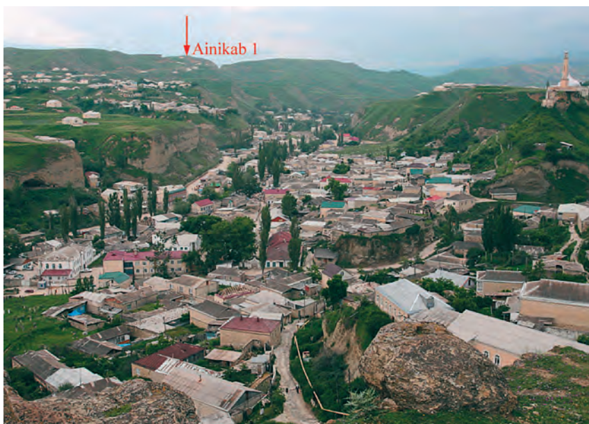
Расположение стоянки Айникаб 1 (показано стрелкой) относительно долины р. Акуша