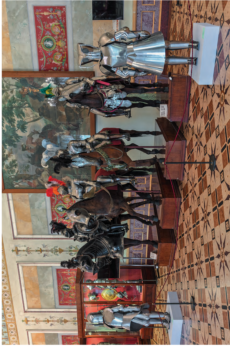
Выставка Яна Фабра «Рыцарь отчаяния — воин красоты». Эрмитаж. Рыцарский зал. 2016—2017