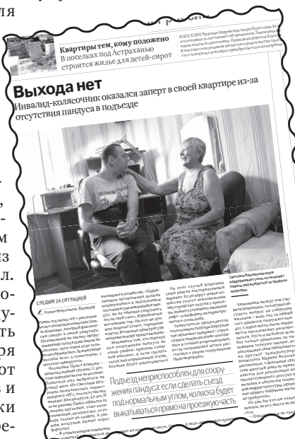
Выхода нет Инвалид-колясочник оказался заперт в своей квартире из-за отсутствия пандуса в подъезде

помещение с учетом потребностей инвалида возможно. Правда, стоимость работ оценили в 456 800 рублей. После чего администрация стала настаивать на проведении общего собрания жильцов, дабы они скинулись на пандус для соседа — ведь не в компетенции управляющей компании