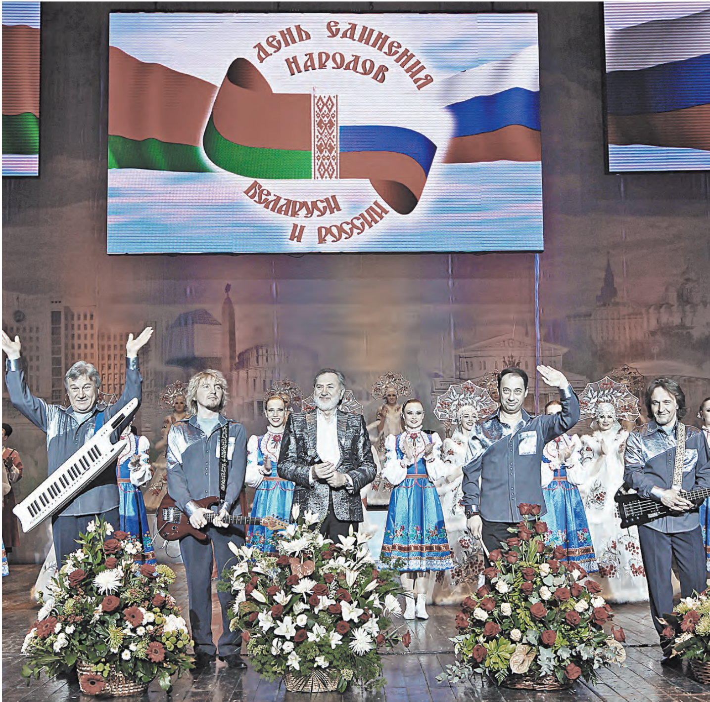
Праздничный концерт в Москве продолжался больше двух часов: на сцену поочередно выходили то белорусские, то российские артисты. Были и «союзные» дуэты. Публика одинаково восторженно встречала всех.

1 → В этом году его постановщики приложили максимум усилий, добавляя действу зрелищности, красочности и динамики. Лазерное шоу, когда разноцветные лучи рисовали перед зрителем в воздухе узнаваемые им очертания российских и белорусских городов, сменилось на заднем плане огромной сцены театра видеопанно — и ария Базилио звучала на фоне итальянских двориков, а «долгое эхо друг друга», о котором нам пела прекрасная Зара, «билося» о стволы уходящих в небо матчтовых сосен.