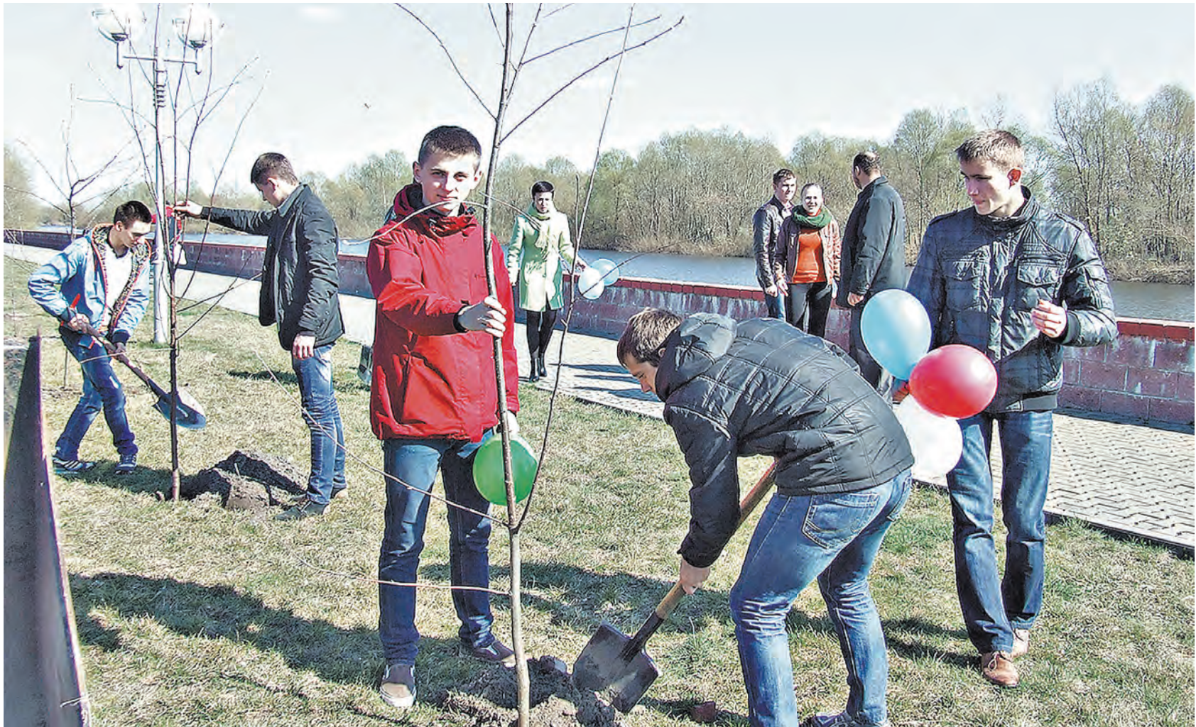
ФОТО ПРЕДСТАВИТЕЛЕЙ ПОЛЕССКОГО ГОСУДАРСТВЕННОГО УНИВЕРСИТЕТА