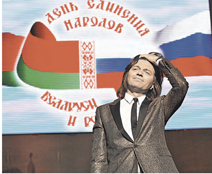
Дмитрий Маликов — завсегдатый российско-белорусских музыкальных вечеров.

— В прошлом году я продолжил свою программу «Уроки музыки» в поддержку начального музыкального образования, обехав почти всю Россию. Я считаю, что наши дети обязательно должны учиться понимать музыку, ведь даже если они не станут профессиональными музыкантами — музыка сделает их лучше, откроет им глаза. Я побывал с «Уроками музыки» уже в 60 российских городах — а в Беларуси еще не был! Надеюсь совсем скоро исправить это — так что, дорогие сябры, ждите, скоро увидимся!