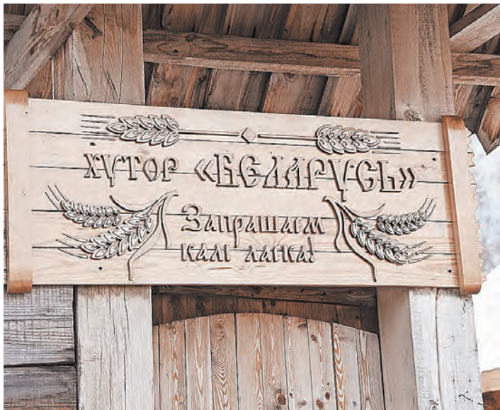
Белорусский хутор — одна из изюминок ЭТНОМИРА.