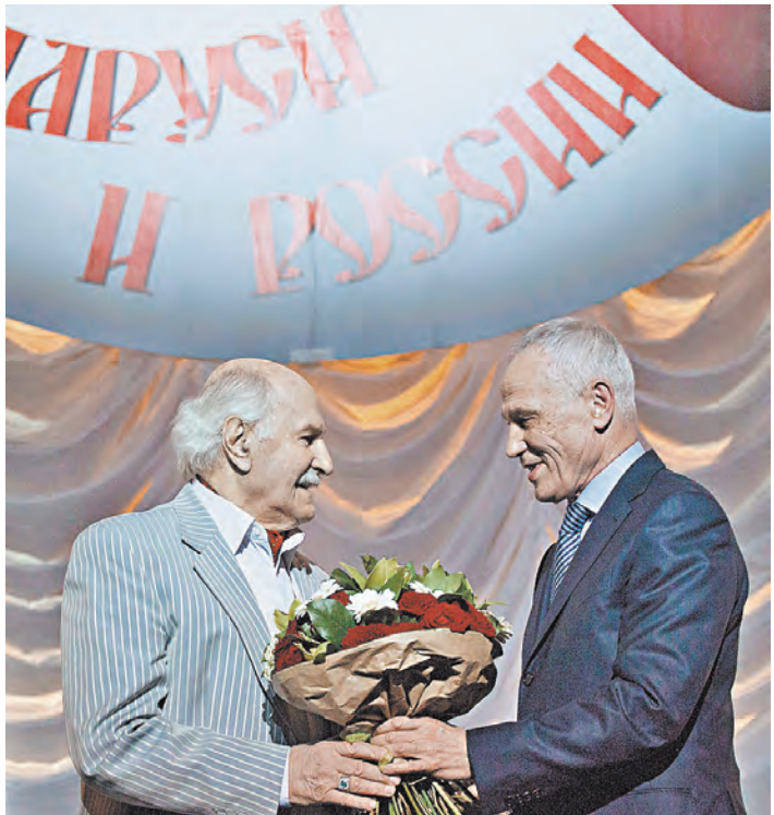
Госсекретарь Союзного государства Григорий Рапота вручил народному артисту СССР Владимиру Зельдину премию Союзного государства в области литературы и искусства.