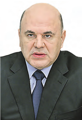
Михаил Мишустин, премьер-министр РФ:

— Уровень безработицы остается крайне низким. Этого удалось достичь благодаря поддержке занятости. Экономика страны продемонстрировала устойчивость и продолжает адаптироваться к сегодняшним реалиям. Правительство должно быть готово к возможным изменениям на рынке труда, которые могут происходить на фоне структурной перестройки экономики. Во многих отраслях сейчас наблюдается дефицит кадров. Необходимо принять конкретные решения для его преодоления.