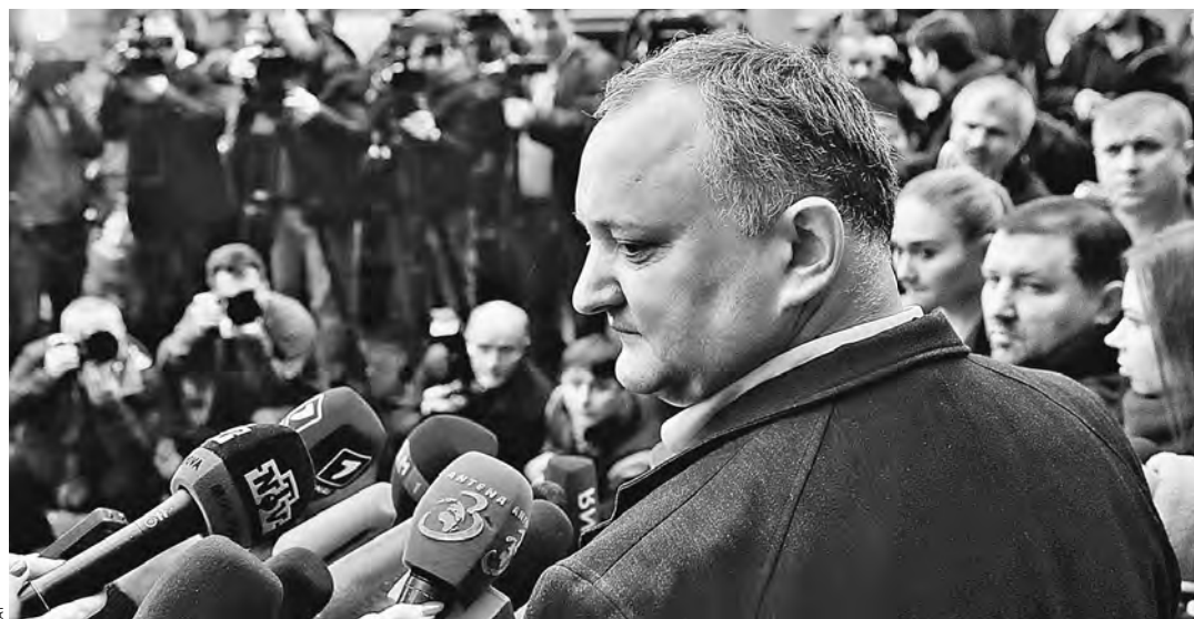
Новоизбранный президент Молдавии Игорь Додон, не скованный обязательствами перед Брюсселем, настроен решительно и намерен отказаться от политического и торгового соглашения с Евросоюзом.

КОШЕЛЕК Граждане начали отсуживать деньги у приставов за испорченный отдых