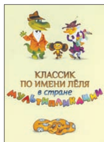
Классик по имени Лёля в стране Мультипликации / Авт. текста Н. Абрамова; фот. Е. Левичева. М.: Ключ-С, 2010. — 164 с.

6 Ему 90 и он «элегантен и безупречен, легок, светел, простодушен и щедр». Эти слова Юрия Норштейна — о Леониде Шварцмане. По его мнению, мало кто догадывается, что «этот джентльмен и Чебурашка — почти одно и то же лицо».