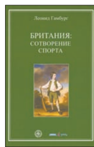
Гамбург Л. Британия: Сотворение спорта. Киев: Саммит-книга, 2010. — 248 с.

7 Иногда с ними — такими сдержанными и холодноватыми — происходят чудеса. Как писал Честертон, какой-то кошмарный ветер врывается в их души, вытаскивает из постели и швыряет в окно... А там, за окном, британские джентльмены при-