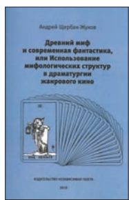
Шербак-Жуков А. Древний миф и современная фантастика, или Использование мифологических структур в драматургии жанрового кино. М.: Независимая газета, 2010. — 168 с. — (Ex Libris).

5 В основе книги диссертация ее автора. В данном варианте объем материала гораздо больше, взгляд на внутренне структуральное родство фольклорной сказки и построения сценария жанрового кино. Миф и архетип присутствуют в них одинаково, но сравнить жанры не пришлось в голову никому.