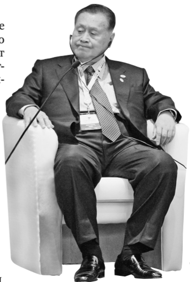
Есиро Мори: Уверен, Путин сумеет выстроить диалог и мирно решить проблему кризиса на Украине.

Председатель Госдумы отметил, что даже сейчас, когда возобновлен переговорный процесс и введен режим прекращения огня, ситуация продолжает оставаться крайне сложной. По словам Нарышкина, санкции против России восприняли в Киеве как поощрение агрессии.