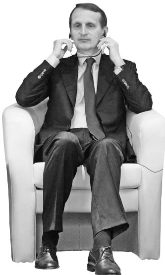
Сергей Нарышкин: Различные проекты России и Японии позволят компенсировать ошибки политики.