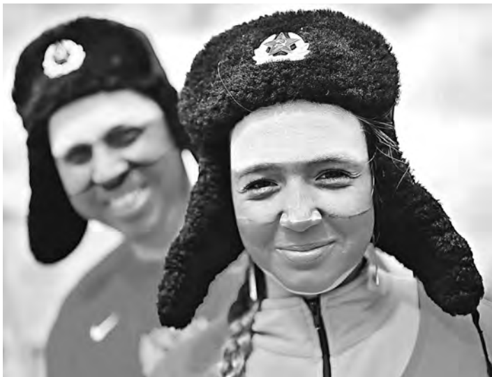
Вчера болельщики со всей России желали нашей хоккейной сборной удачи в финале чемпионата мира против канадцев.

—Никогда не ругай своих игроков, слышишь. Надо просто верить в их поддержку,—мужчина в свитере с фамилией «Малкин» на спине, обняв товарища,