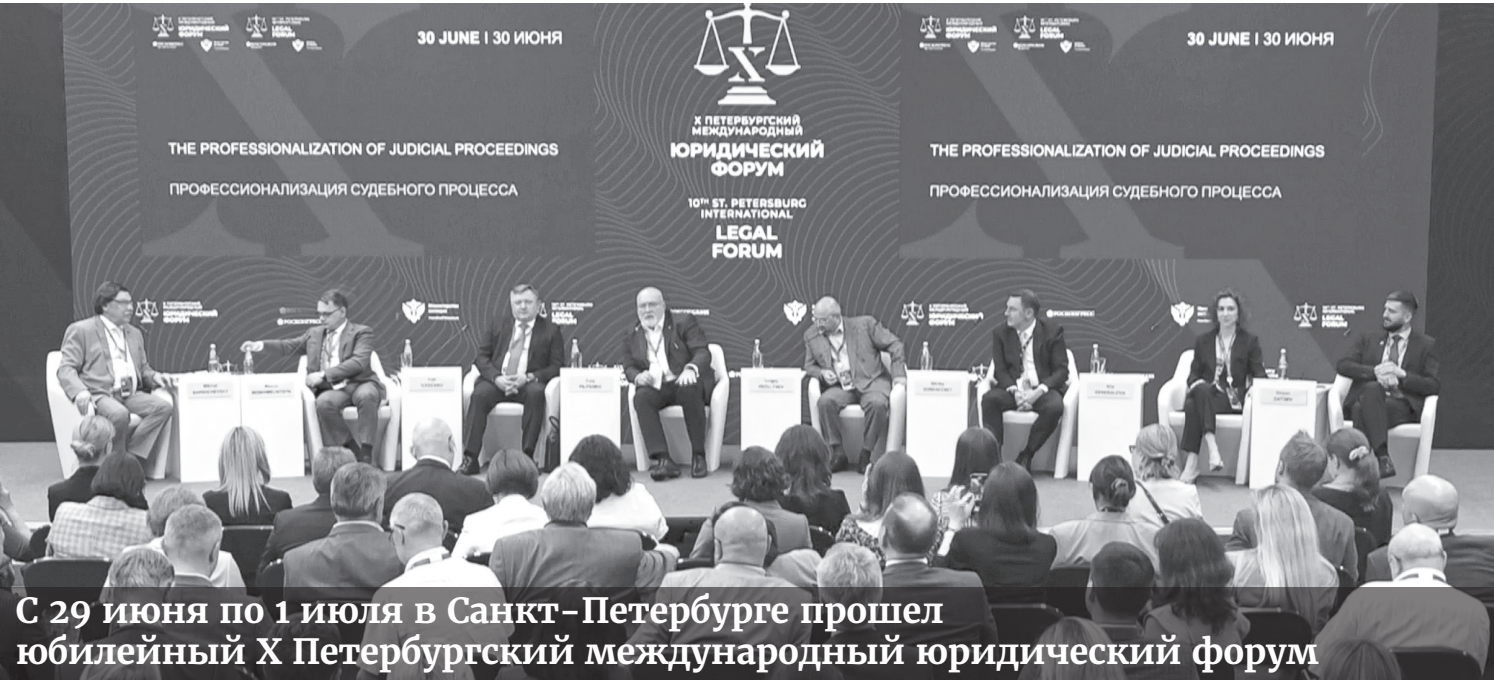
С 29 июня по 1 июля в Санкт-Петербурге прошел юбилейный X Петербургский международный юридический форум