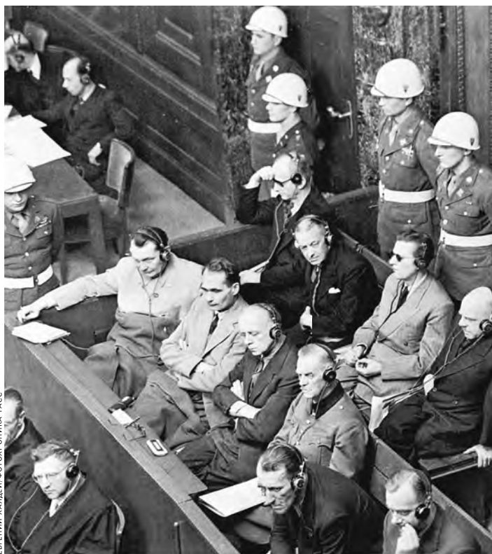
Главные нацистские военные преступники на скамье подсудимых.