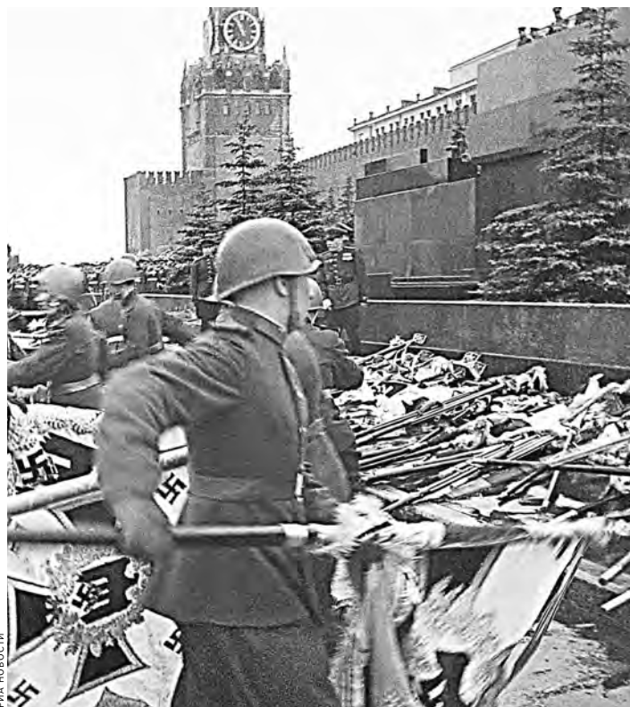
Знамена поверженных фашистских армий падают к стенам Кремля.

Парад Победы, который ровно 70 лет назад прошел по Красной площади: неизвестные детали и подробности