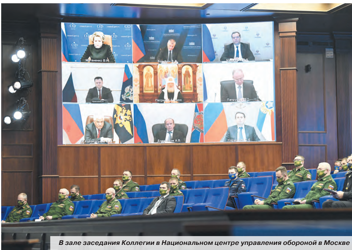
В зале заседания Коллегии в Национальном центре управления обороной в Москве

Расширенное заседание коллегии Минобороны