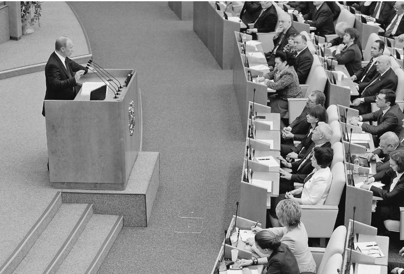
Владимир Путин рассчитал прыжок на 100 мест и шесть лет

— Первое — это демографическая состоятельность россий-