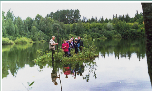
Озеро Шайтан и плавающие острова

Одно из самых уникальных озёр России – озеро Шайтан – расположено в Кировской области в 39 км от города Уржума. Оно имеет карстовое происхождение, питают его подземные грунтовые воды и атмосферные осадки. Название «Шайтан» ещё в давние времена дали ему местные жители, которых пугали его необычные особенности. Прежде всего это странные дрейфующие острова, на которых растут кусты и небольшие деревца и которые могут выдержать вес не одного человека. Другая необъяснимая особенность озера, имеющего глубину 25 метров, – выброс фонтанов и столбов воды, достигающих порой 10-метровой высоты. Они возникают спонтанно и бывают стремительно быстрыми, так что увидеть их удаётся не часто.