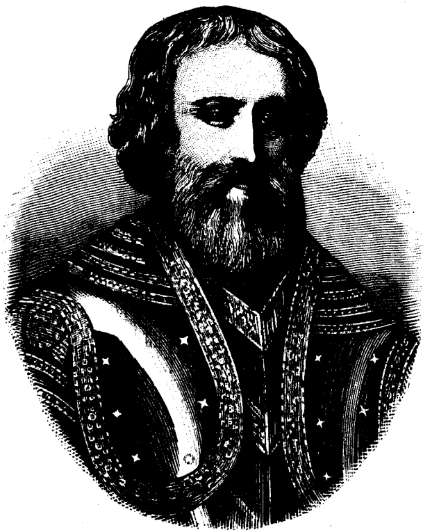
Бояринъ Артамонъ Сергѣевичъ Матвѣвъ.

— А вѣдь я жениха-то для твоей воспитанницы нашелъ.