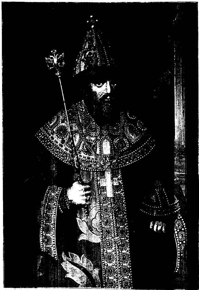
Царь Алексѣй Михайловичъ.

всѣ сношенія съ иностранными государствами, часто сталкивался съ иноземцами и отчасти даже самъ жилъ на иностранный ладъ. Домъ свой онъ устроилъ по-заграничному, обставилъ его привозной мебелью, украсилъ часами, картинами, и, кромѣ того, перенялъ у иностранцевъ обычай не