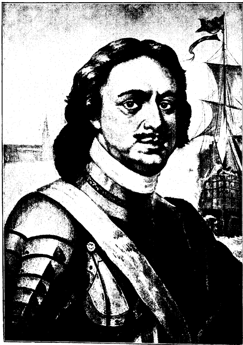
Императоръ Петръ Великій.