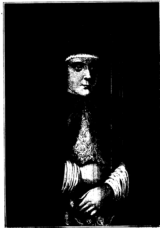
Наталья Кирилловна Нарышкина.

А Красивая, скромная и благочестивая Наталья Кирилловна очень понравилась государю, который, бывая у Матвѣева, каждый разъ подолгу разговаривалъ съ молодой дѣвушкой и, наконецъ, плѣненный ея качествами, рѣшилъ на ней жениться.