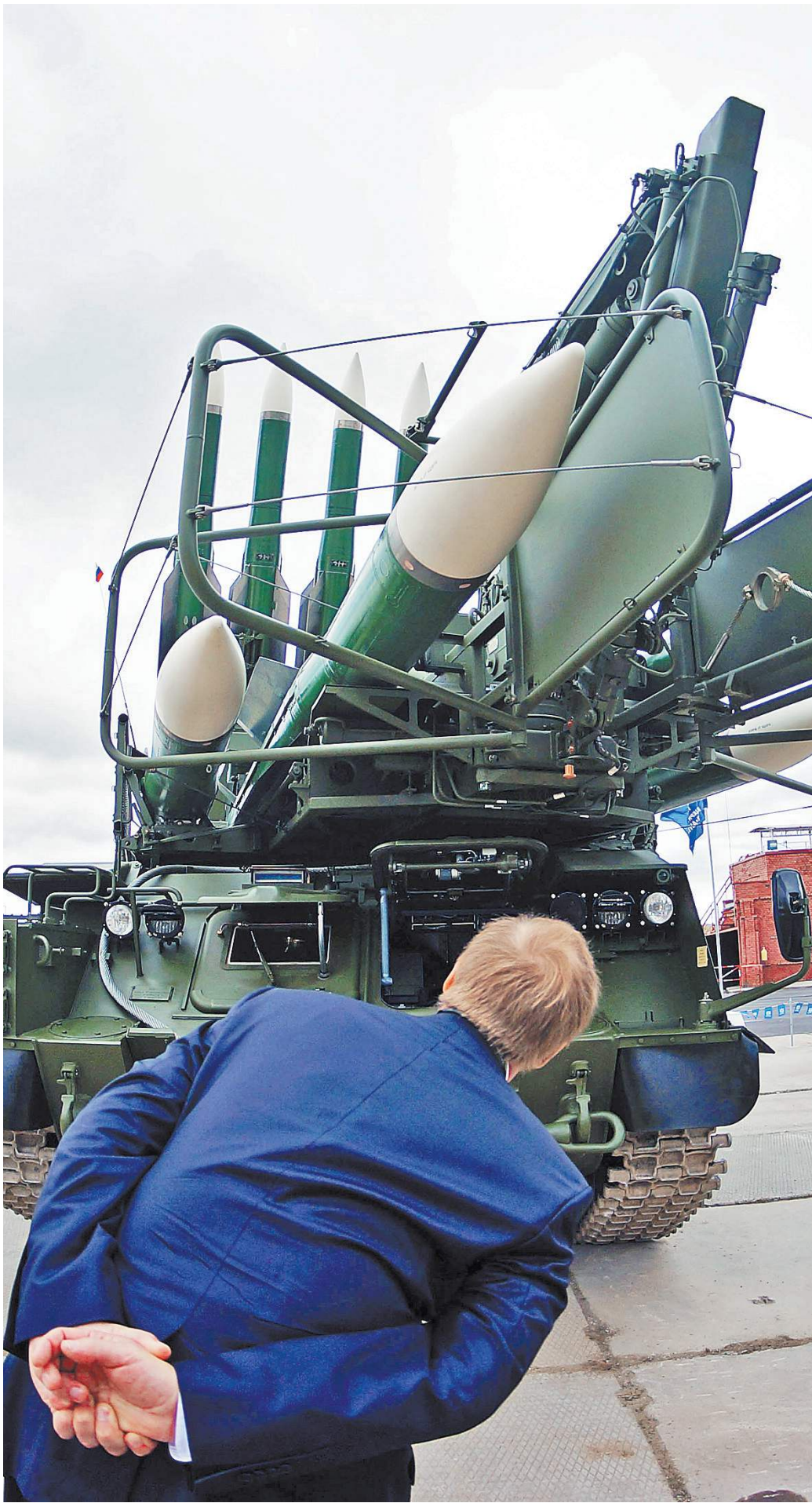
Военная техника из России стабильно вызывает интерес на международных выставках.

лашников АК-19. Он разработан под патрон 5.56x45 мм, принятый на вооружение в странах НАТО и широко распространенный в мире. Представлена и линейка гражданских вертолетной техники. Интерес к ней на Ближнем Востоке традиционно высок. Например, Ми-171А3 — первый специализированный отечественный вертолет для перевозок над морем и обслуживания удаленных от береговой черты шельфовых буровых платформ. Легкий двухдвигательный многоцелевой вертолет «Ансат» будет представлен на выставке в санитарной версии. Решать вопросы пожаротушения призван модернизированный Ка-32А11М. На международных выставках его мы демонстрируем впервые. Это новейшая версия противопожар-