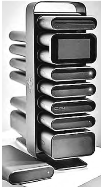
Нужен компьютер? — Сделай сам.

ситуация Atom-money в Интернете обещают всем, кто не владеет здравым смыслом Игра для простаков