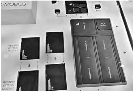
Умные носки защитят ноги бегуна от травм.