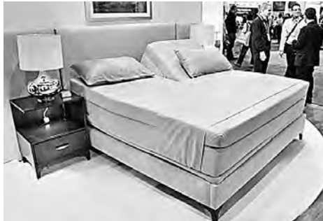
Кровать, которая слишком много знает.