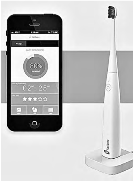
Приложение знает, как чистят зубы ваши дети.

Настоящий фурор произвел принтер под названием ChefJet, способный печатать съедобные объекты. Владелец этого агрегата сможет «выпекать» сладости любой формы, наделяя их шоколадным, мятым, ванильным и другими вкусами. ChefJet за пять тысяч долларов печатает сладости из одного цвета, ChefJet Pro вдвое дороже и печатает объекты смешанных цветов.