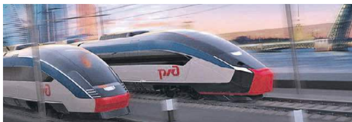
Схема организации ВСМ между Москвой и Санкт-Петербургом и ее финансирования была утверждена на совещании, которое президент Владимир Путин провел во время своего визита на предприятие «Уральские локомотивы» (к будущему проекту века оно имеет непосредственное отношение). Там же были озвучены и основные

характеристики новой дороги. Как поедет, как помчимся?