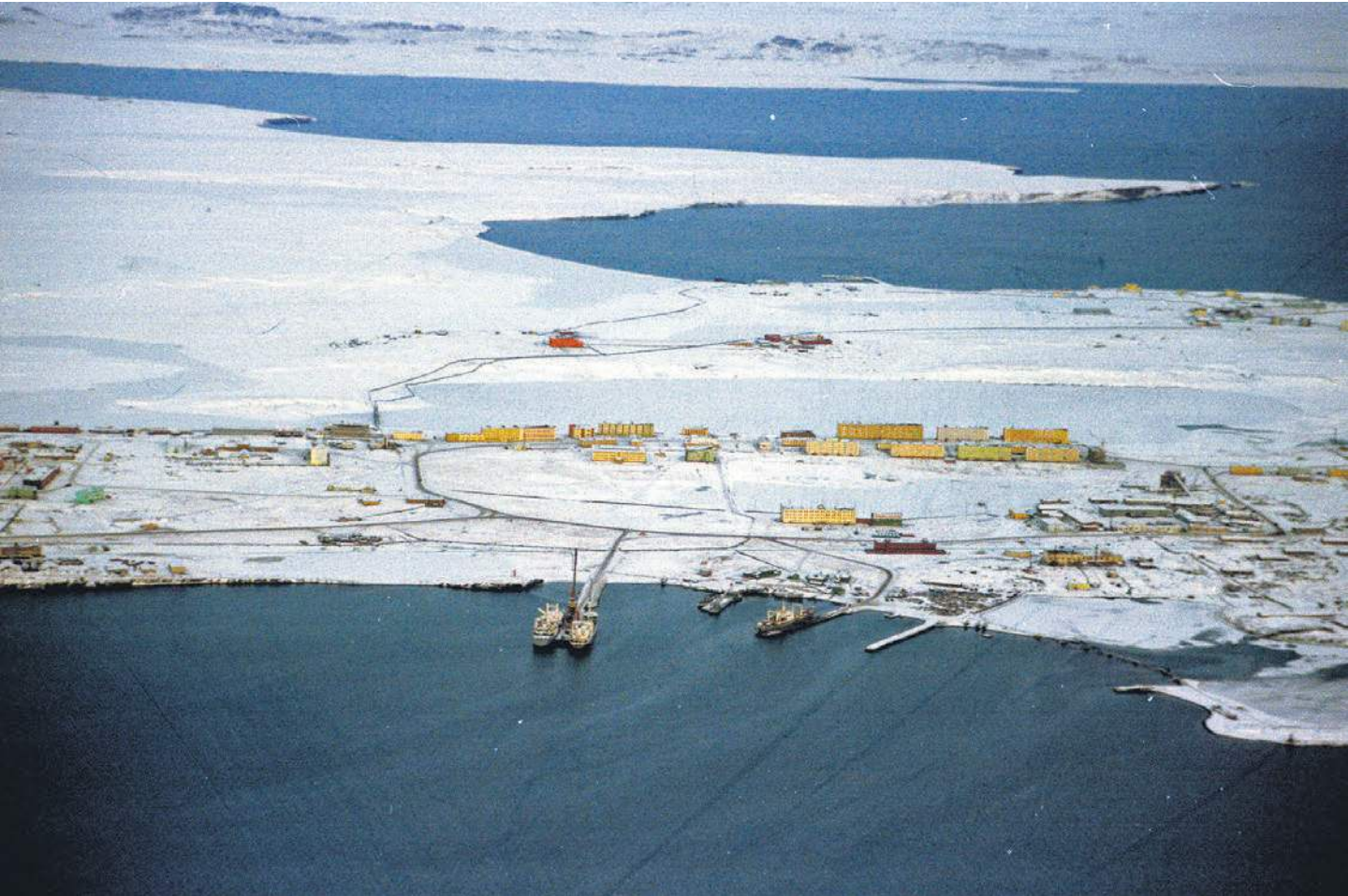
В России все чаще звучат голоса в поддержку испытаний ядерного оружия — например, на архипелаге Новая Земля (на фото). Но Владимир Путин считает, что время для этого еще не пришло

О том, что Россия могла бы дератифицировать ДВЗЯИ, чтобы уравнять ситуацию с США, Владимир Путин сказал, отвечая на вопрос одного из основателей клуба «Валдай», почетного председателя президиума Совета по внешней и оборонной политике Сергея Караганова. Политолог при этом спросил президента не о ДВЗЯИ, а о возможности изменения российской доктрины применения ядерного оружия в сторону понижения ядерного порога, чтобы, как он выразился, «отрезвить партнеров». Владимир Путин ответил, что не видит в этом необходимости. И обнародовал другое предложение: «повести себя зеркально в отношении с Соединенными Штатами», которые подписали, но не ратифицировали ДВЗЯИ, в то время как Россия сделала и то и другое. «В принципе зеркально повести себя с теми же Соединенными Штатами можно. Но это вопрос депутатов Государственной думы. Теоретически можно отозвать эту ратификацию. Если мы это сделаем, этого будет вполне достаточно»,— сказал президент.