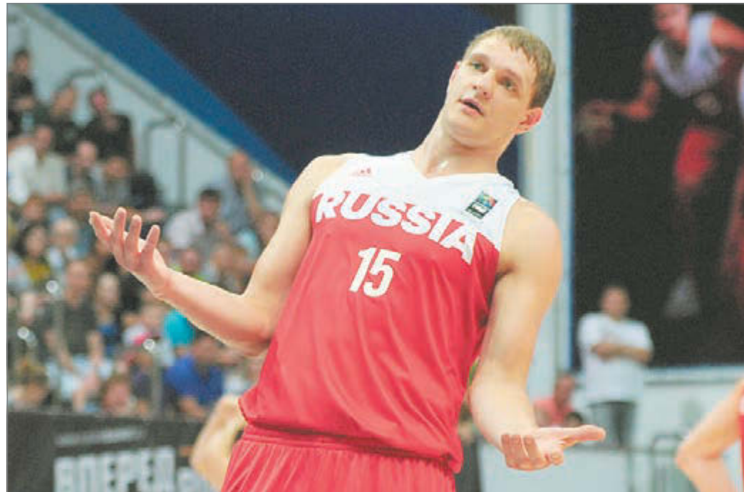
Тимофей МОЗГОВ, скорее всего, не сыграет за сборную России на чемпионате мира.