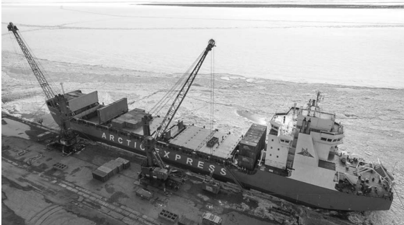
Порты, работающие в арктических условиях, оснащены на самом высоком уровне.

Согласно данным Ассоциации морских торговых портов, в морских терминалах Арктического бассейна за 2018 год было перевалено 92,7 миллиона тонн грузов, что на 26,4 процента больше, чем за 2017 год. Рост обусловлен увеличением объемов внутренних перевозок полезных ископаемых, добытых на арктической территории. По итогам прошедшего года объем перевалки наливных грузов увеличился на 41 процент — до 62,3 миллиона тонн.