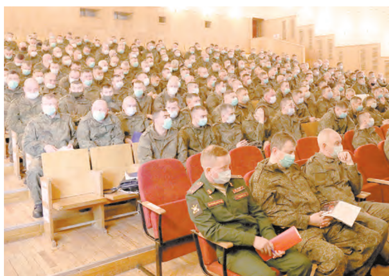
В условиях пандемии новой коронавирусной инфекции сбор был организован со строгим соблюдением всех необходимых санитарных требований

Прямая ссылка: https://www.youtube.com/channel/UCbAo_491-EdB-t6iuRp5NDQ