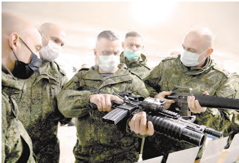
Чтобы качественно учить подчинённых, командиры и начальники должны сами безукоризненно владеть оружием и вверенной боевой техникой