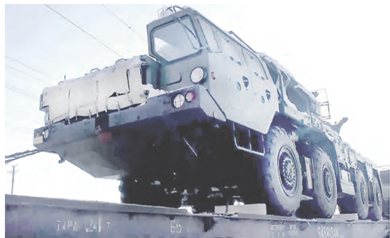
Ракетный тягач из дивизиона зенитно-ракетных комплексов С-400 «Триумф» во время передислокации из Хабаровского края в Белоруссию

Президент России выразил надежду, что диалог по теме гарантий безопасности будет продолжен. А говоря о выполнении минских соглашений, обратил внимание на разные заявления по этому поводу.