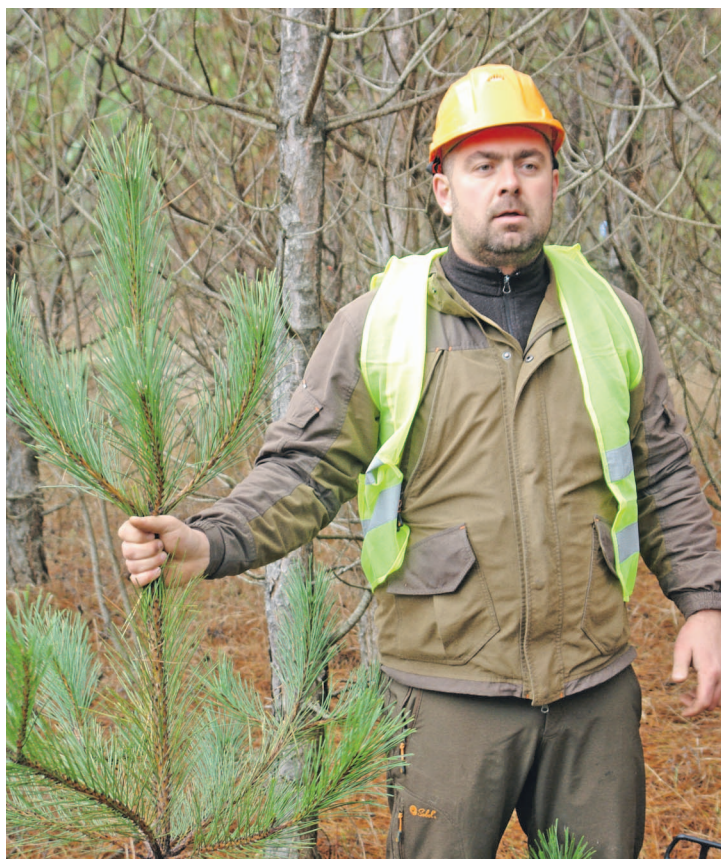
Только четверть спиленных деревьев пойдет на базары.

Прореживать молодые посадки необходимо, чтобы их кроны не смыкались, солнечный свет проникал до самой земли, а корни оставшихся растений получали больше питания. Здесь на пяти гектарах вблизи пещерного городища Чуфут-Кале проводят уже вторую рубку. Первая была примерно десять лет назад. Как и тогда, лесоводы убирают больные, слабые, искривленные растения, оставляя более сильные. А этот участок примечателен еще и тем, что 20 лет назад на нем впервые отработали новую тогда для Крыма технологию высадки в грунт рассад с закрытой корневой систе-