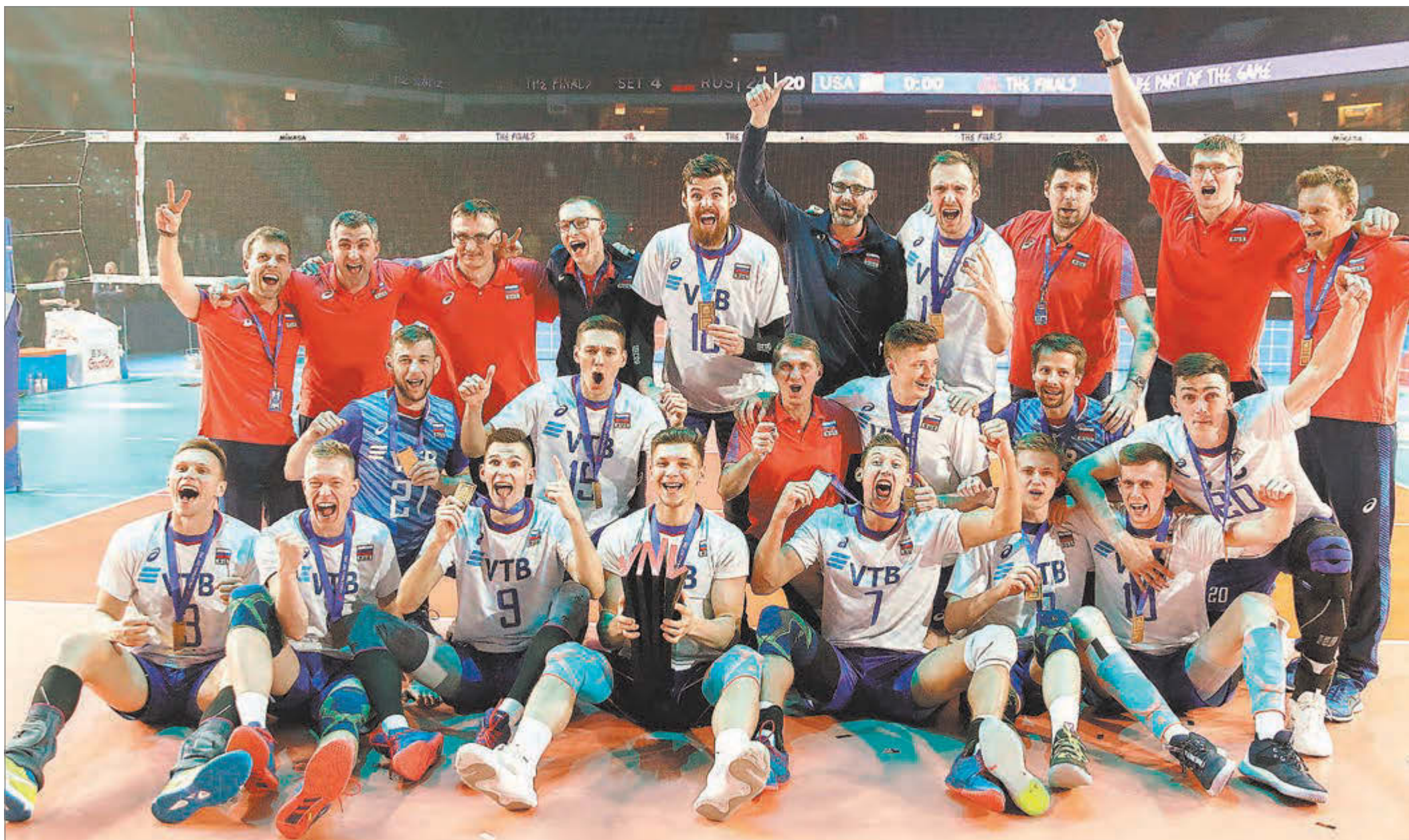
Вчера. Чикаго. Сборная России с золотыми медалями Лиги наций.

Это шестой титул российских волейболистов на больших соревнованиях за последние семь лет.