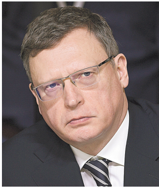
Александр Бурков, губернатор Омской области

В Омской области это тоже не единственная инициатива по развитию логистического потенциала региона. Ранее губернатор Александр Бурков в эфире местного телеканала заявил, что онлайн-ритейлер вышел к областным властям с предложением о строительстве складских помещений общей площадью 100 тысяч квадратных метров. ●