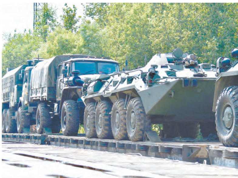
Эшелоны с российской военной техникой идут на запад

В соответствии с замыслом учения численность участвующих в нём войск, танков, боевых бронированных машин, РСЗО и артиллерийских систем, количество планируемых самолётвылетов не превышает уровень, подлежащий обязательному наблюдению за определёнными видами военной деятельности.