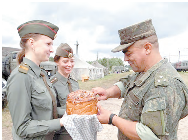
Хлебом-солью встречают россияне белорусские коллеги