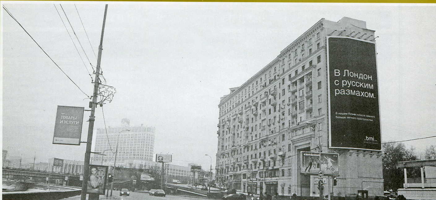
Место убийства экс депутата Госдумы РФ Руслана Ямадаева Сентябрь 2008 Москва 250 метров от Белого Дома