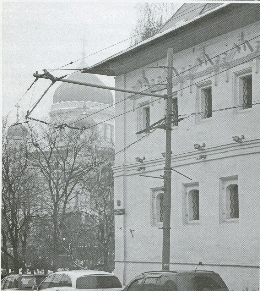
Место убийства адвоката Станислава Маркелова и журналистки Анастасии Бабуровой Январь 2009 Москва 500 метров от Храма Христа Спасителя 1500 метров от Кремля