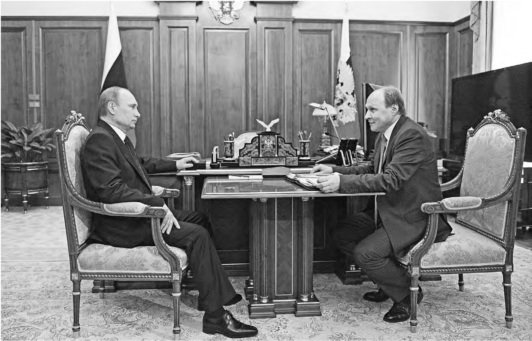
Вчера состоялась рабочая встреча президента Владимира Путина с советником по культуре при главе государства Владимиром Толстым. Новые основы государственной политики в области культуры должны создавать в России единое культурное пространство, заявил президент. Он также обратил внимание на то, что одновременно нужно создавать благоприятные условия для развития учреждений культуры, своевременного финансирования мероприятий в этой сфере.

— Специальная комиссия оценит участников по технике пилотирования, степени поражения наземных целей, качеству преодоления системы ПВО, а также соблюдению мер безопасности. По результатам отборочного этапа лучшие летчики представят округ на соревнованиях летных экипажей Военно-воздушных сил России «Авиадартс-2014», — сказали в пресс-службе округа.