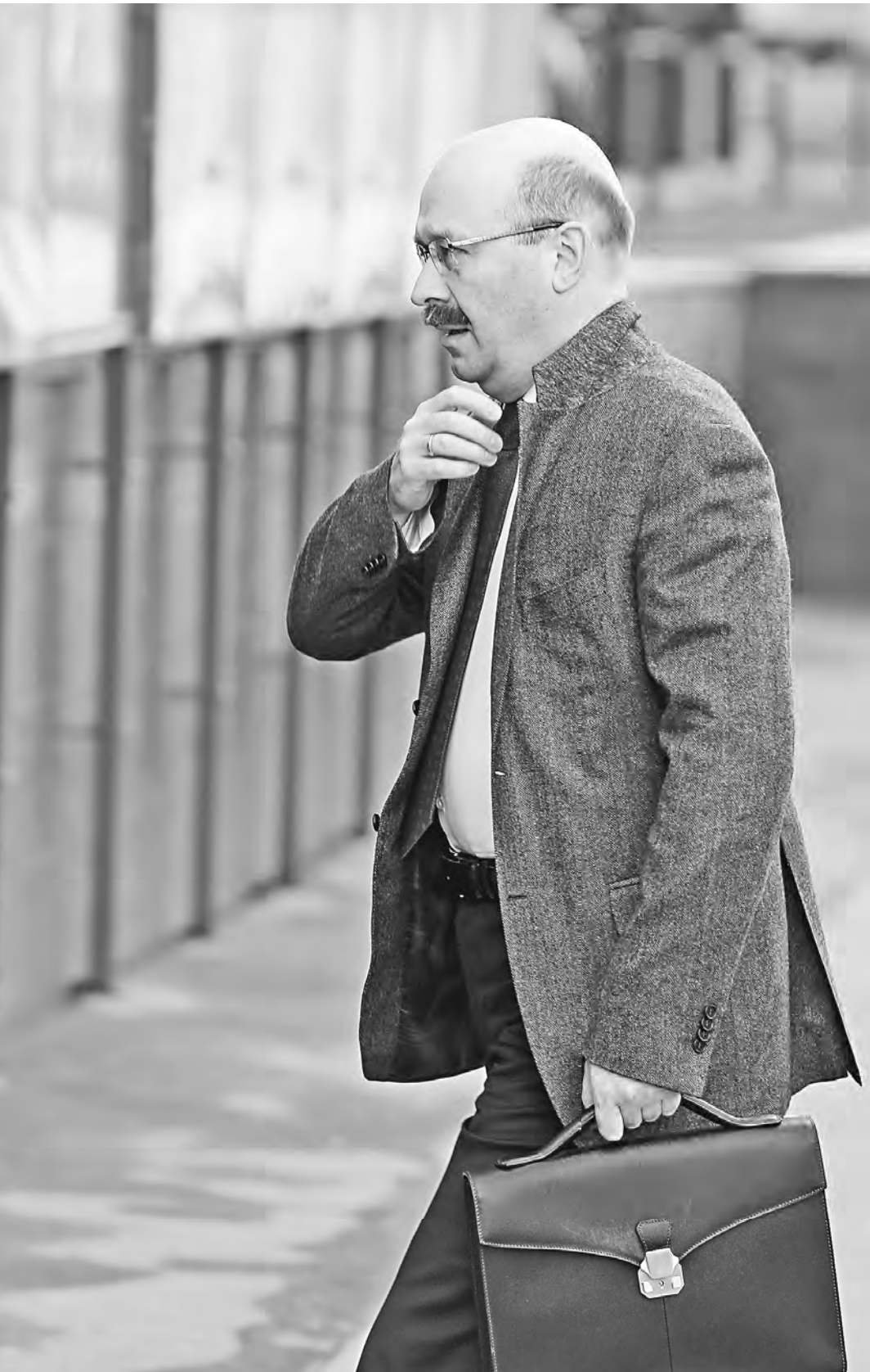
Михаил Задорнов: Крупные банки в Крым не придут.

Михаил Задорнов: Мы, безусловно, заметили этот отток, если говорить в целом о банковской группе ВТБ. В марте у нас около 13 миллиардов ушло со счетов. Такого не было даже осенью 2008 года в период экономического кризиса. Но, в отличие от всего рынка, нам за первый квартал 2014 года удалось привлечь примерно 25 миллиардов рублей средств населения. Особенно в январе и феврале. Теперь о том, куда россияне понесли снятые с собственных счетов деньги. Все эти средства пошли по трем основным направлениям. Первое и самое большое — люди конвертировали рубли в иностранную валюту. Причем как в наличную, так и в безналичную форму. И в основном размещали их в банковские ячейки. Есть такая практика, которая свойственна некоторой части российских граждан еще с периода 2004–2008 годов. То есть человек снимает средства и считает, что для него надежнее держать деньги не на банковском счете, а в банковской ячейке.