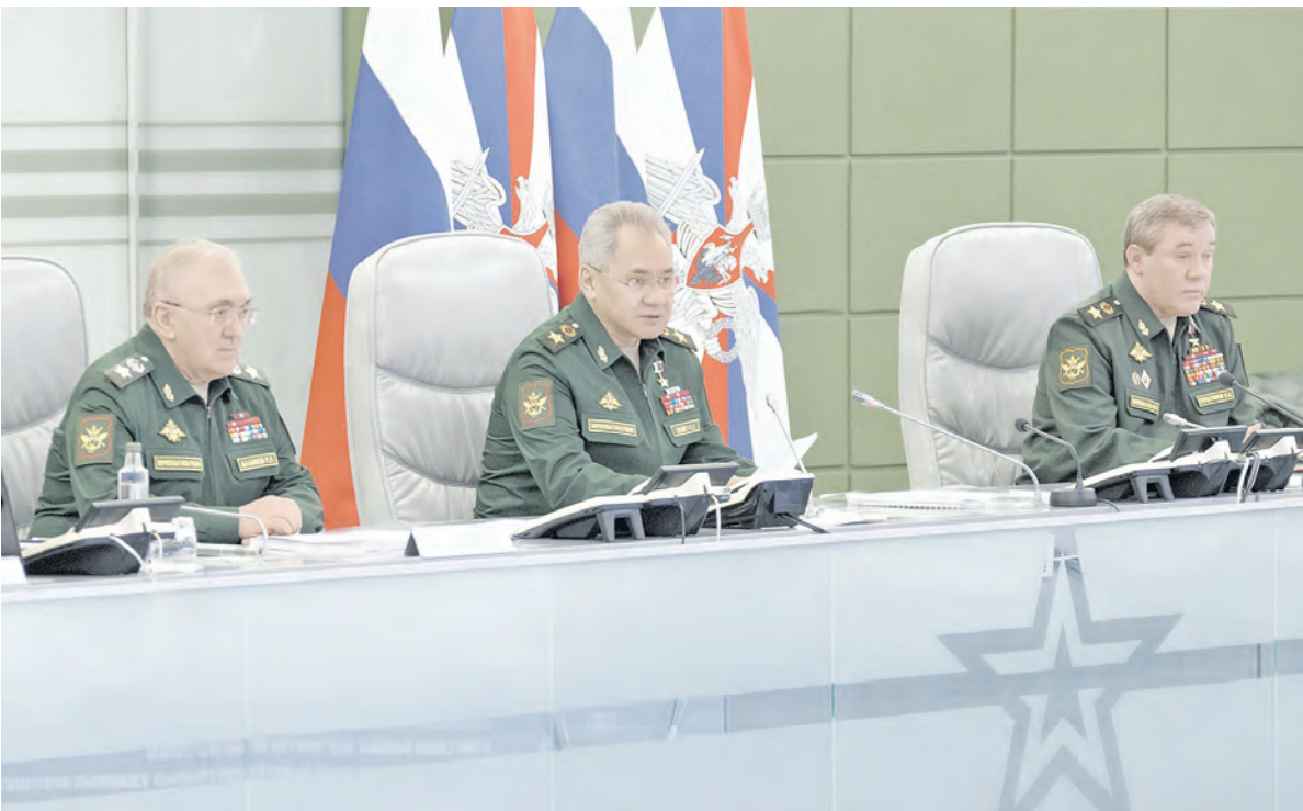
Единый день приёмки военной продукции в Национальном центре управления обороной Российской Федерации в Москве

Возведено более 690 объектов сил и средств ядерного сдержива-