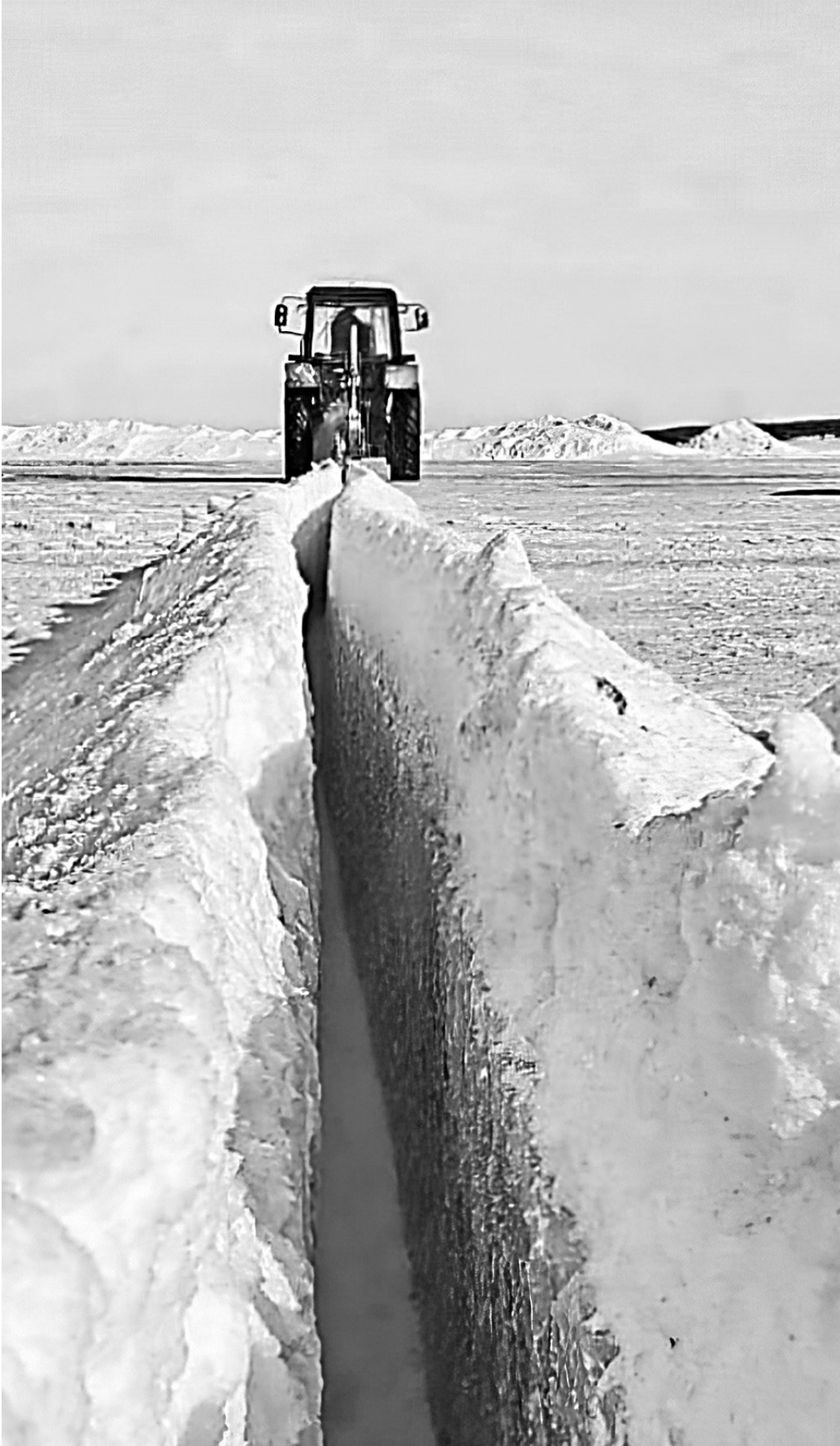
Распиловку льда на реках Якутии проводят для того, чтобы избежать заторов в период половодья.