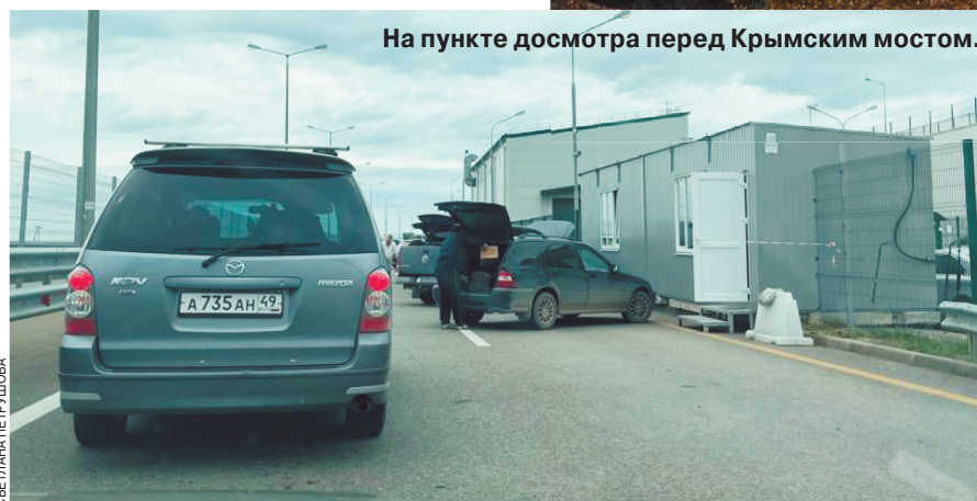
На пункте досмотра перед Крымским мостом.