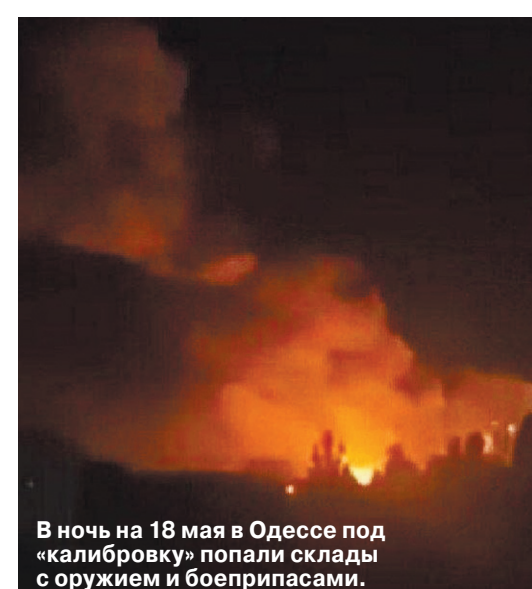
В ночь на 18 мая в Одессе под «калибровку» попали склады с оружием и боеприпасами.