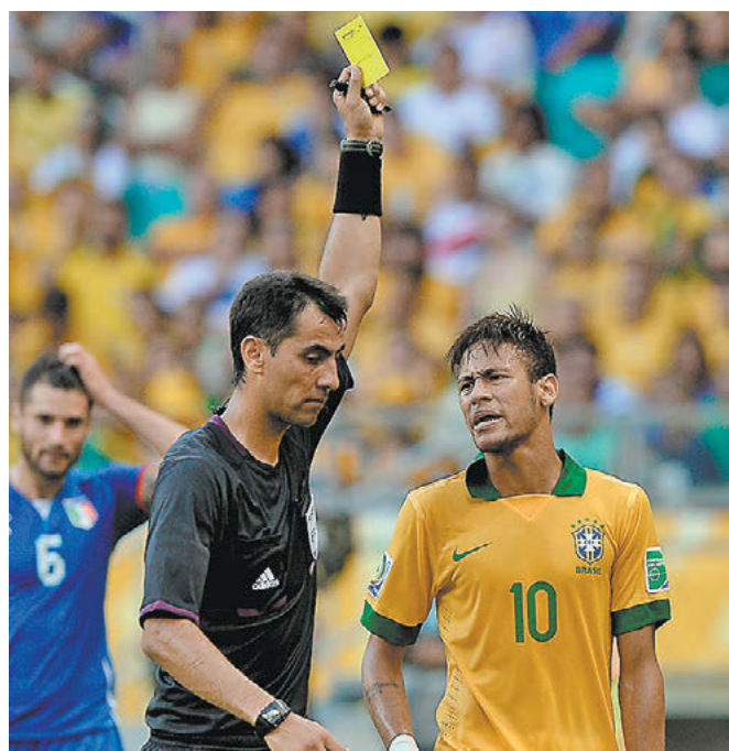
22 июня 2013 года. Сальвадор. Матч группового турнира Кубка конфедераций-2013. Италия – Бразилия – 2:4.