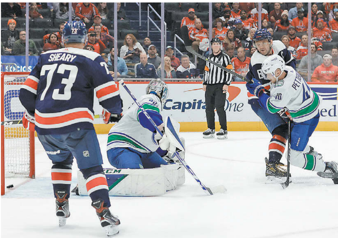
Вчера. Вашингтон. «Вашингтон» – «Ванкувер» – 6:4. 58-я минута. Александр Овечкин (№ 8) забрасывает свою вторую шайбу