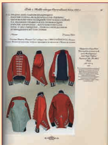
Страница из первой книги двухтомника