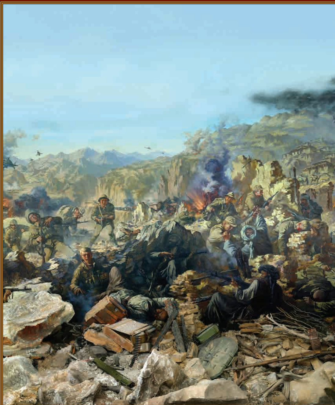
Фрагмент диорамы «Афганская война, как это было» Художник М.С. Сватула, 2003 г. Музей-диорама воинов-интернационалистов, г. Харьков

15 февраля 1989 года, 25 лет назад, закончился вывод советских войск из Афганистана