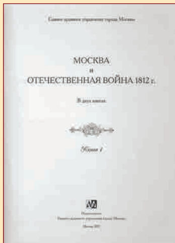
Титульный лист первой книги