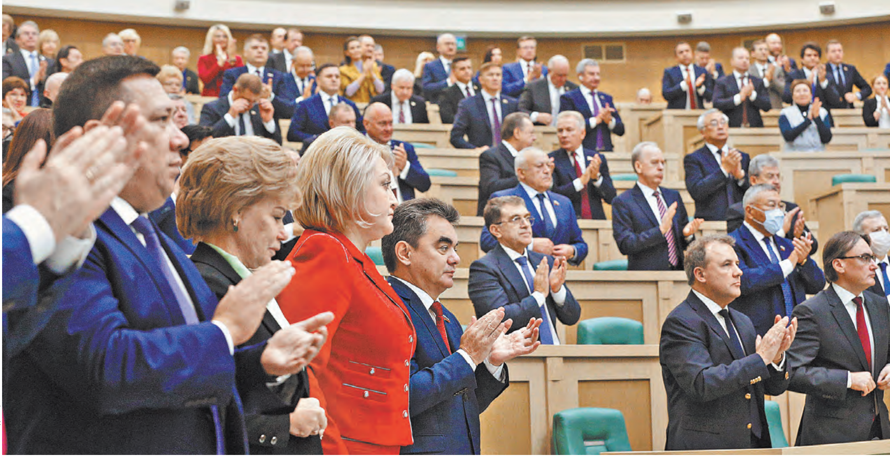
Сенаторы единогласно одобрили пакет документов и встретили аплодисментами историческое решение палаты.

Выступая перед сенаторами, министр иностранных дел РФ Сергей Лавров заявил, что граждане республик и областей сделали свой осознанный выбор через право на самоопределение. Он обратил внимание на то, что сама Украина фактически превратилась в «агрессивное, тоталитарное государство, где принимаются дискриминационные законы, проводится насильственная украинизация, поощряется русофобия, массово ущемляются языковые, об-