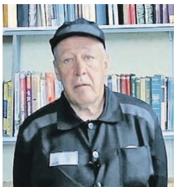
Кадр из видео

С тех пор как Михаил Ефремов попросил смягчить на-